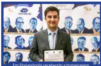
Em Florianópolis recebendo a homenagem