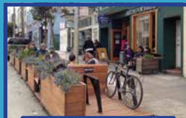
Exemplo de parklet em San Francisco / Califórnia

Atendendo sugestões da comunidade, o projeto regulamenta a instalação e utilização de "parklets". Semelhantes a miniparques, esses espaços ocupam vagas de estacionamento público,