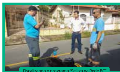
Fiscalizando o programa "Se Liga na Rede BC"

Ações de governo foram acompanhadas, nas mais diversas áreas como por exemplo o programa "Se Liga na Rede BC", (que foi iniciado após indicação nº 211/2016 do vereador) e que é essencial para a despoluição dos rios e praias. Foram feitos pedidos de informações e contatos com secretarias, visando atender as demandas da comunidade, com estudos relevantes dos projetos e participação ativa nas discussões em plenário. Os posicionamentos foram significativos, buscando o melhor para a cidade, por exemplo, contra o aumento de tributos, sugerindo a adoção de modelos que ampliem a receita sem gerar custos para a população como o direito à denominação de espaços e eventos públicos bem como a publicidade. (Lei nº 3.907/2016 - Naming Rights, iniciativa de André Meirinho quando atuou como Secretário da Fazenda).